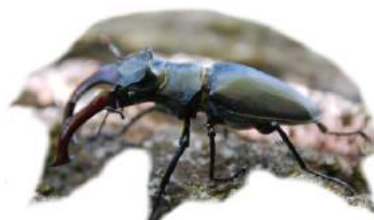
Lucanus cervus Rădașca

Materiale folosite: replici de animale (albina, fluture, covașul, calugarița, furnica, rădașca, șopârla, napârca, șarpele de cristal, broaște), tipărituri color de mărime A3 pentru jocul „Bătălia naturii”, insigne cu animale, replici pentru stadiile de viață ale animalelor (fluture, buburuză, broască, albină)