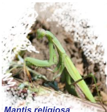
Mantis religiosa Călugărița

Activitățile au avut loc în 8 școli din tot atâtea localități: Școala Gimnazială Albești, Școala Gimnazială Apold, Școala Gimnazială Biertan, Școala Gimnazială Bunești, Școala Gimnazială Laslea, Școala Gimnazială Ion Dacian Saschiz, Școala Gimnazială Seleuș (comuna Daneș), Școala Gimnazială Vânători,.