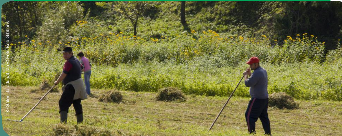
>> Săteni la acunat fân

Suținerea micilor producători .....pag. 4