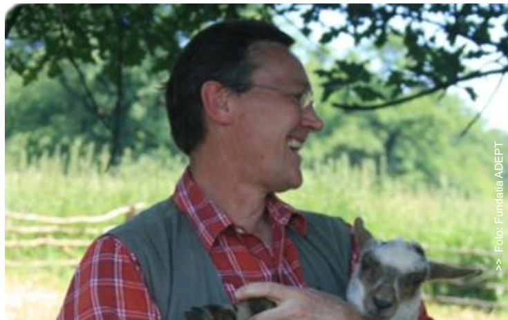
Rat Page Director ADEPT Transilvania

1 LIFE este un program de finanțare prin Fondul European de mediu, prin care se derulează proiecte de conservare a naturii, politici de mediu sau proiecte de informare și comunicare